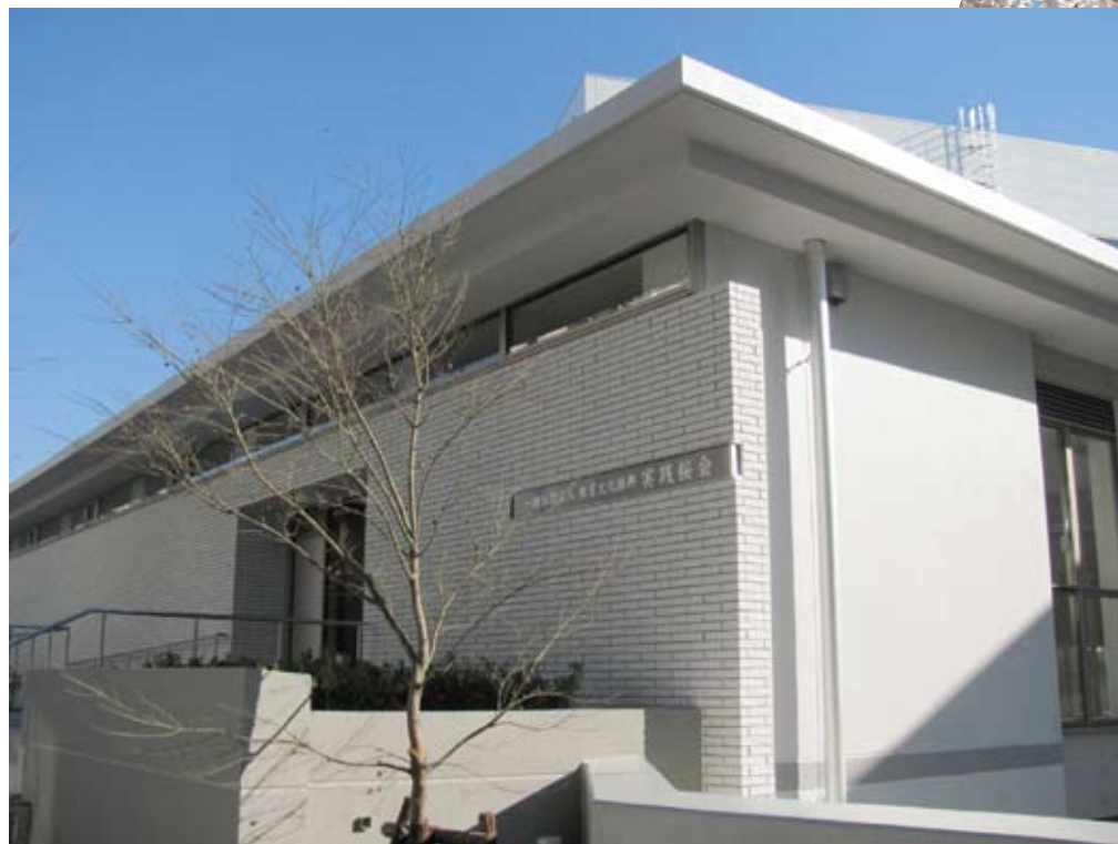
実践桜会新会館（右上：学園桃天館前の桜）