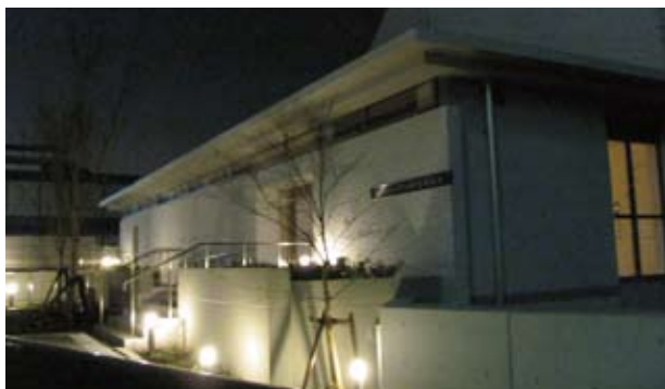
実践桜会新会館の夜景