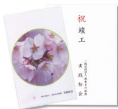
竣工祝いの記念品