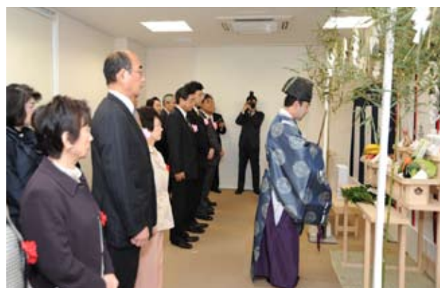
実践桜会新会館の竣工式