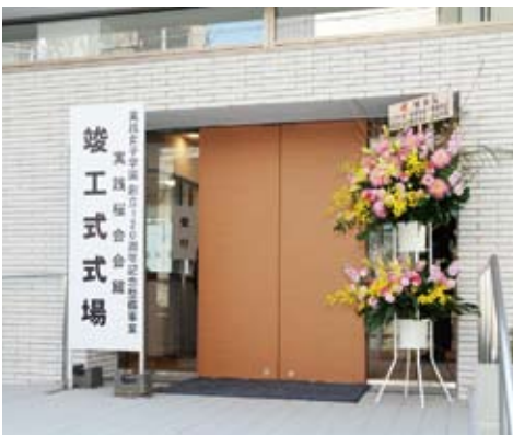
6科会から寄贈されたお祝いのフラワースタンド