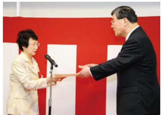
直会での感謝状贈呈