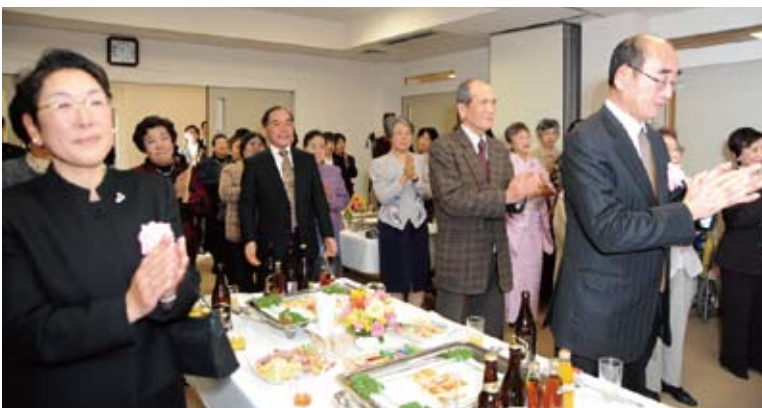
完成を祝して三本締め