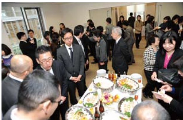
にぎやかなパーティー会場