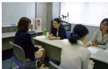
就職相談会の模様